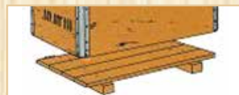
Q03 - Q04 - Q05: fondo in tavole spessore 2 cm., con 2 travetti cm. 5 x 10.