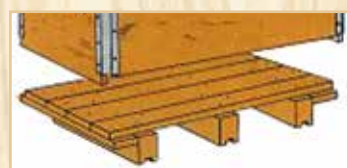
Q06 - Q07 - Q08: fondo in tavole spessore 2 cm., con inforcamento a quattro vie.